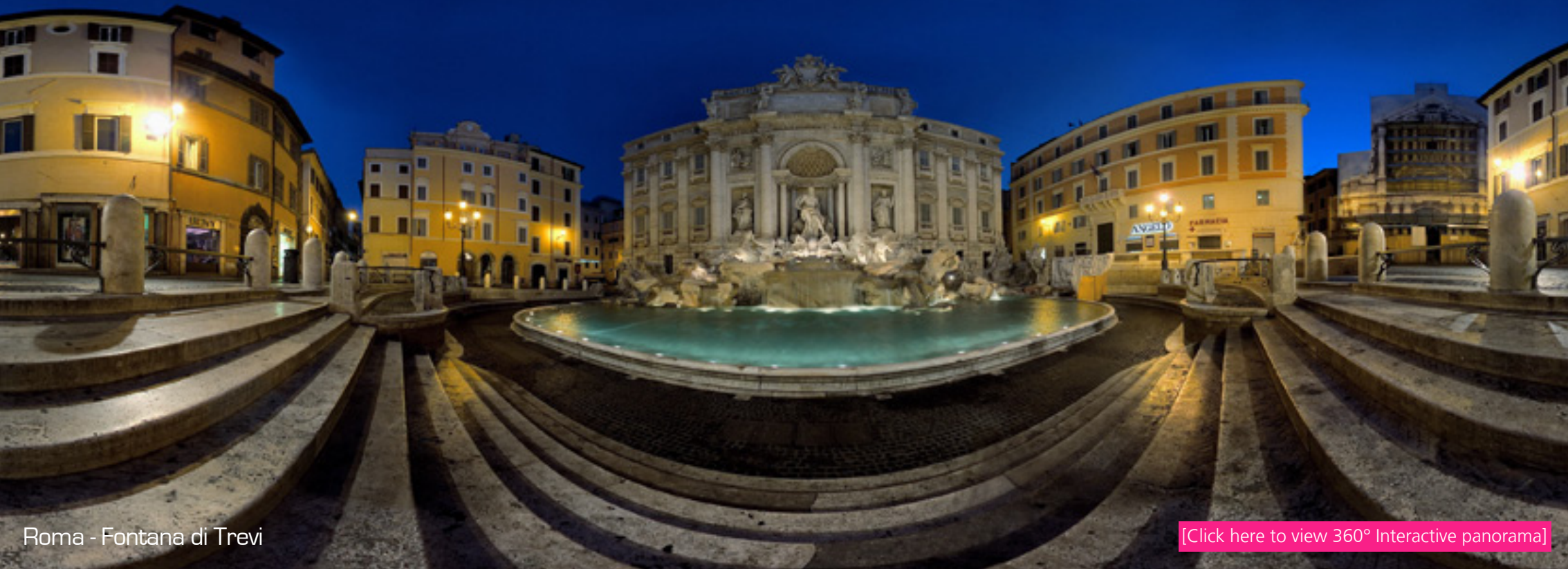
Roma - Fontana di Trevi

Dal 1931 - Pasticceria - Gelateria - Caffetteria