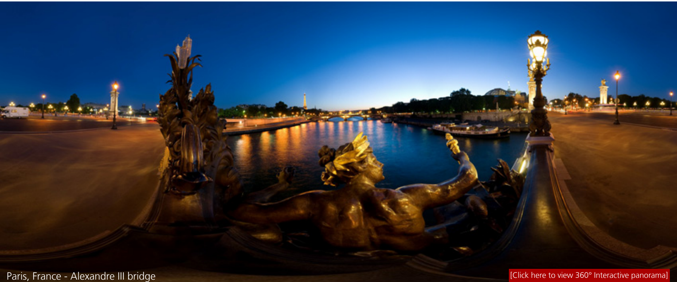
Paris, France - Alexandre III bridge

[Click here to view 360° Interactive panorama]