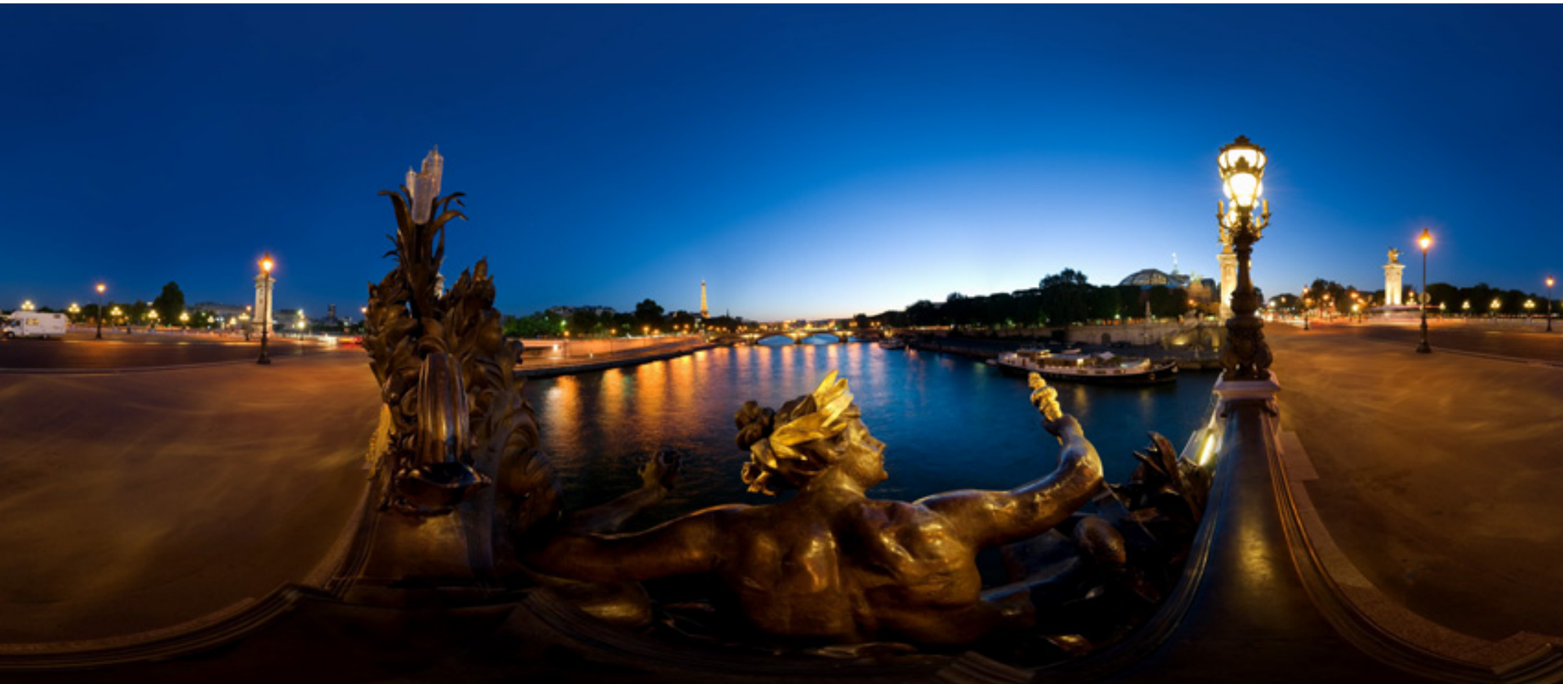
Paris, France - Alexandre III bridge

[Click here to view 360° Interactive panorama]