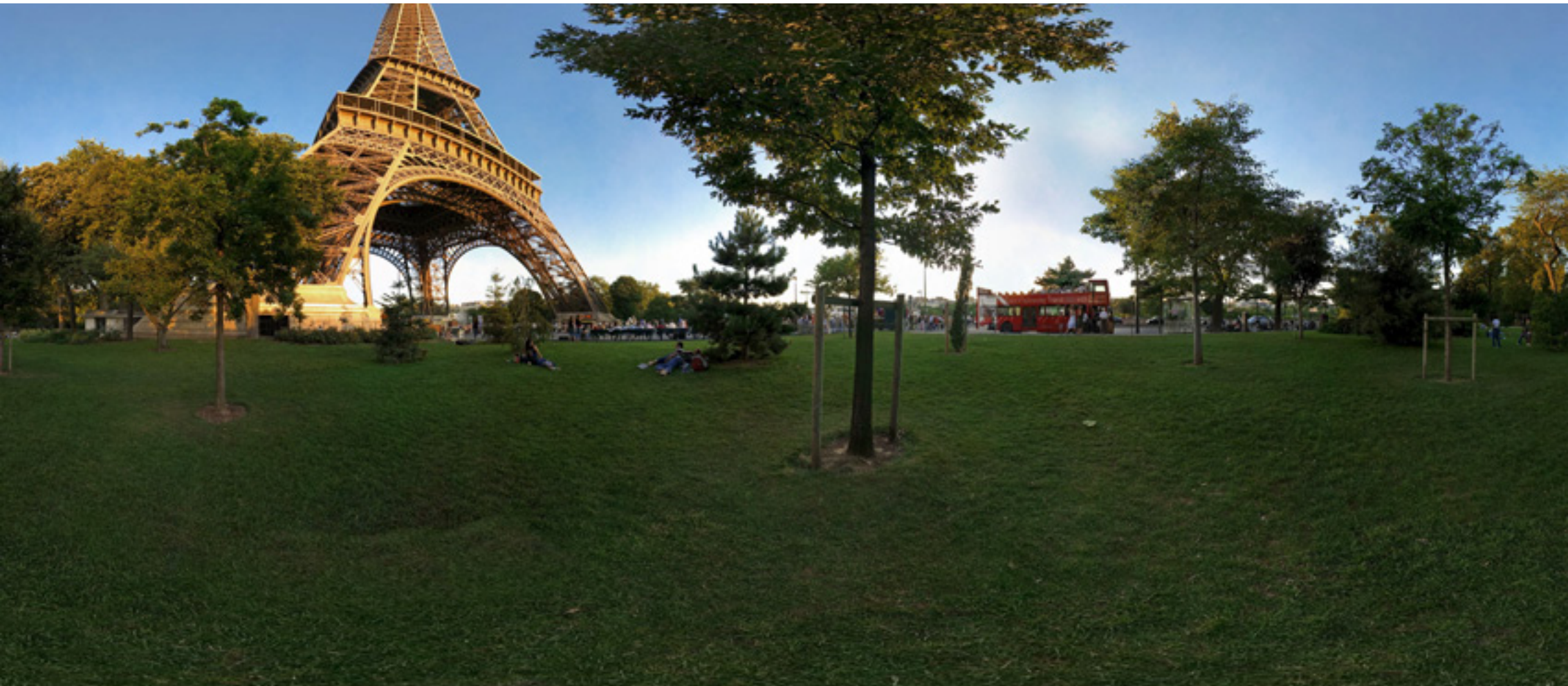
Paris, France - Tour Eiffel

[Click here to view 360° Interactive panorama]