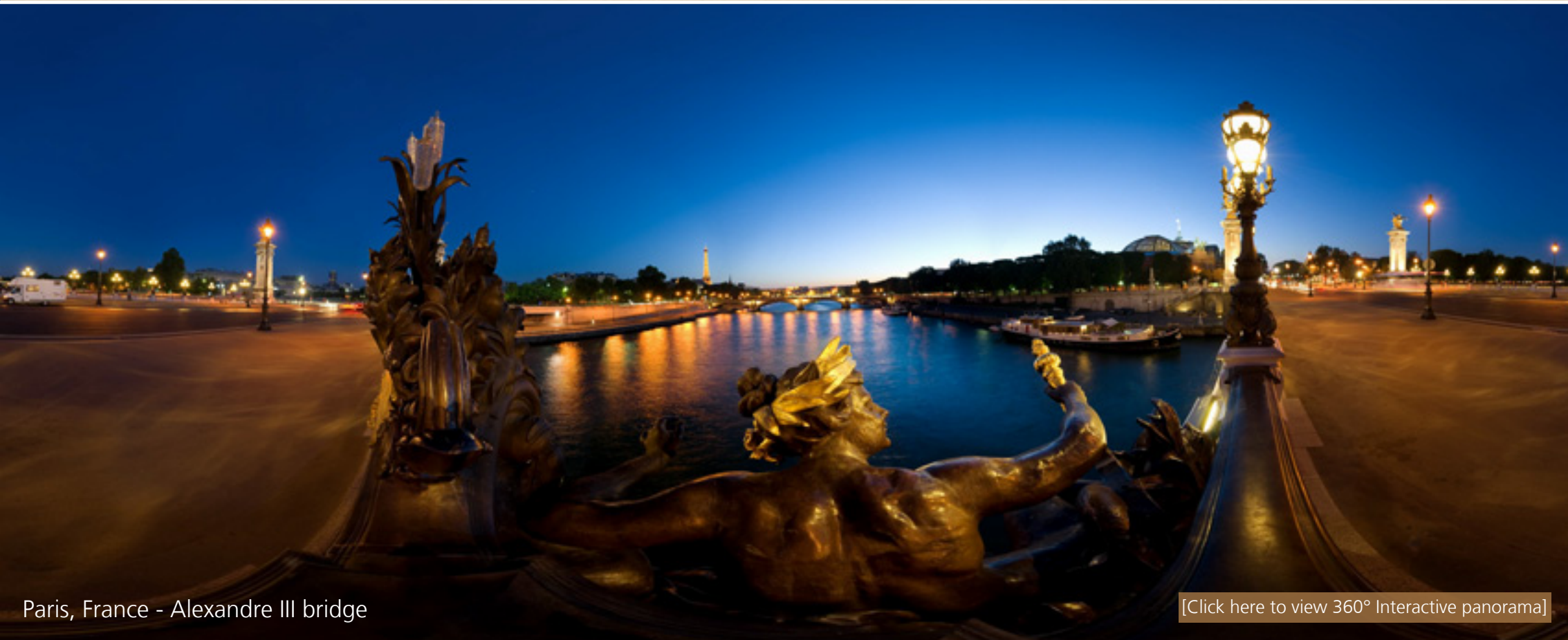
Paris, France - Alexandre III bridge

14 quai de la Loire 75019 Paris - tél. : 01 42 39 68 98