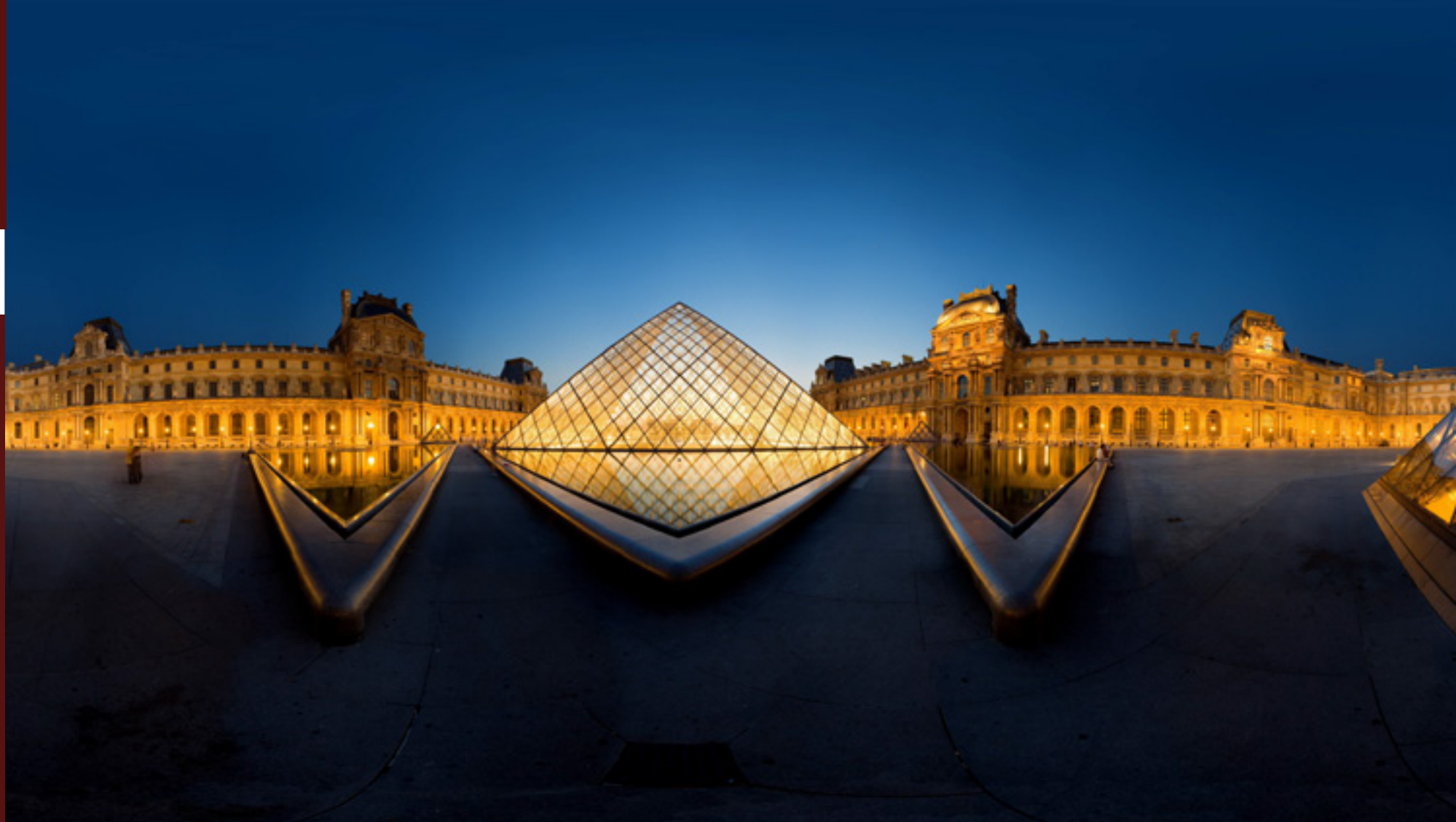
Paris, France - Louvre

[Click here to view 360° Interactive panorama]