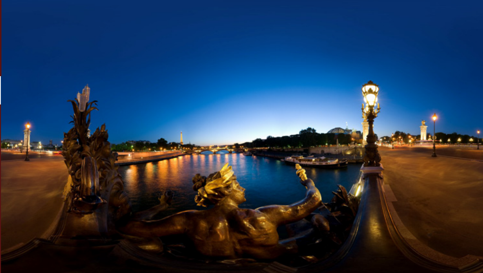
Paris, France - Alexandre III bridge

[Click here to view 360° Interactive panorama]