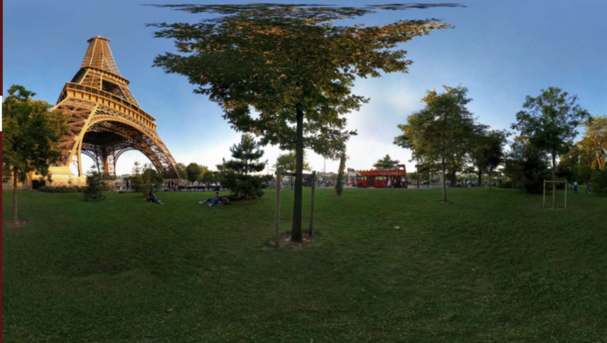
Paris, France - Tour Eiffel

[Click here to view 360° Interactive panorama]