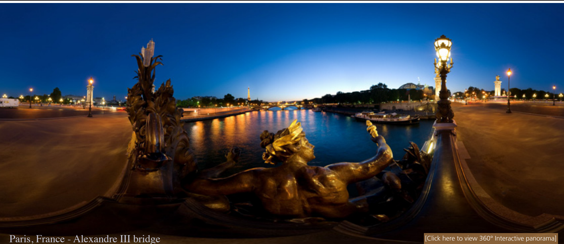
Paris, France - Alexandre III bridge

[Click here to view 360° Interactive panorama]